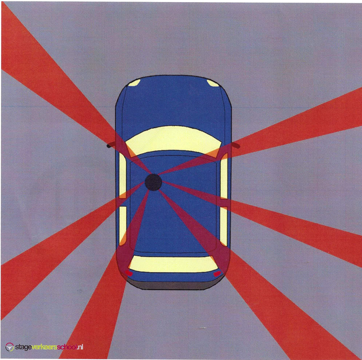
Dode hoeken personenauto